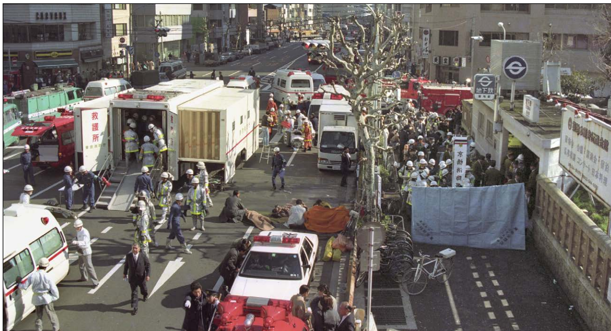
Рисунок 1 – Эвакуация пораженных в результате теракта с использованием зарина в токийском метро (URL: https://www.japantimes.co.jp/news/2018/03/19/national/crime-legal/1995-aum-sarin-attack-tokyo-subway-still-haunts-leaving-questions-unanswered/ Дата обращения: 11.12.2022)

апреля 2017 г. в Хан Шайхуне, который в тот момент находился вне контроля Правительства Сирийской Арабской Республики.